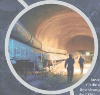
Ausschachtungsarbeiten für die unterirdischen Beschleunigeranlagen des CERN.