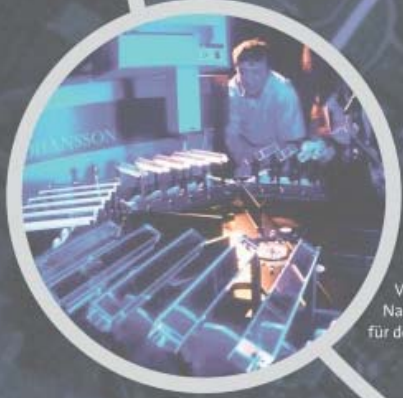
Vermessung von Kristallen zum Nachweis von Elektronen und Photonen für den CMS Detektor am LHC.