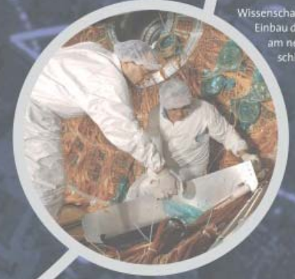
Wissenschaftler beim Einbau des ATLAS Detektors am neuen Protonbeschleuniger LHC.