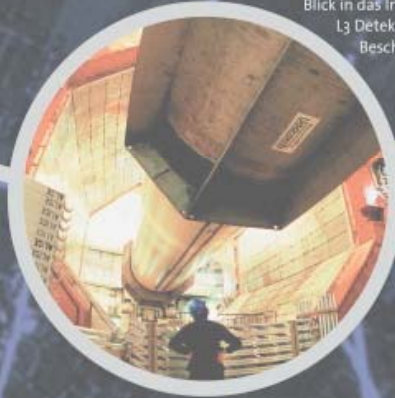
Blick in das Innere des L3 Detektors am Elektron-Positron Beschleuniger LEP.