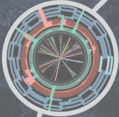
Simulation einer Teilchenkollision im ATLAS Experiment am LHC.